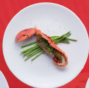
Langosta 60 s