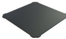
Placa de cocción Número de pieza: DC0322

Para más accesorios, consulte nuestro folleto de accesorios del Merrychef eikon® e1s.