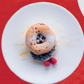
Bagel con arándanos 30 s