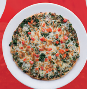
Pizza 140 s