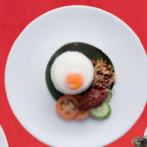
Nasi lemak 75 s