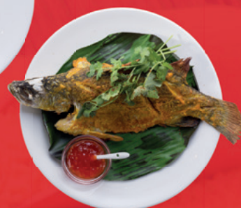
Corvina 180 s