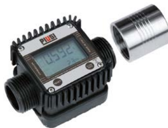
K24 VERSIÓN DE PLÁSTICO